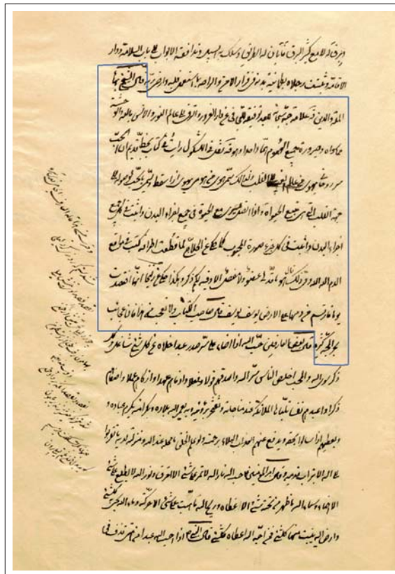
▲ نسخه منهج السالکین و وسیله نجات الهالکین آقا حسین بروجرودی نسخه کتابخانه ملی (عبارت تطبیق شده جهت شناسایی کتاب)

شناسایی و مستندسازی کتاب «منهج السالکین و وسیله نجات الهالکین»