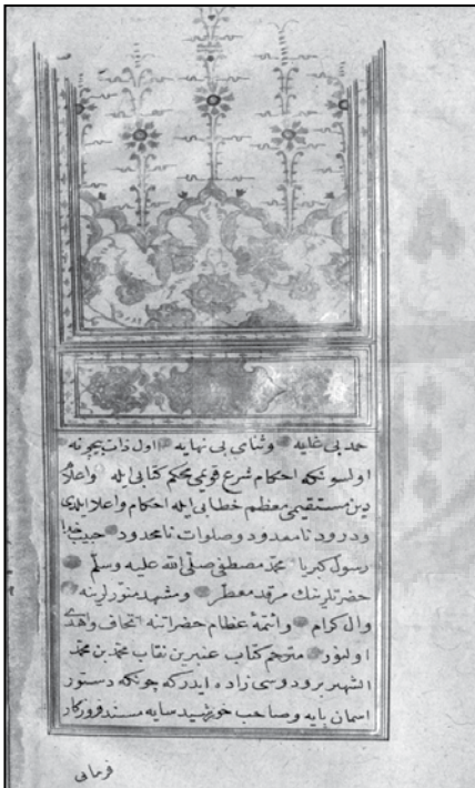
برگ نخست ترجمه کتاب الخراج نسخه کتابخانه دانشگاه آن آربر میشیگان

در این کتاب، مؤلف در پانزده فصل به معنای خراج، مقام علمی مؤلف کتاب الخراج، و آشنایی با مطالب آن، بیان فصل‌هایی از کتاب الخراج در باب احادیث ترغیب و تشویق، احکام غنائم،