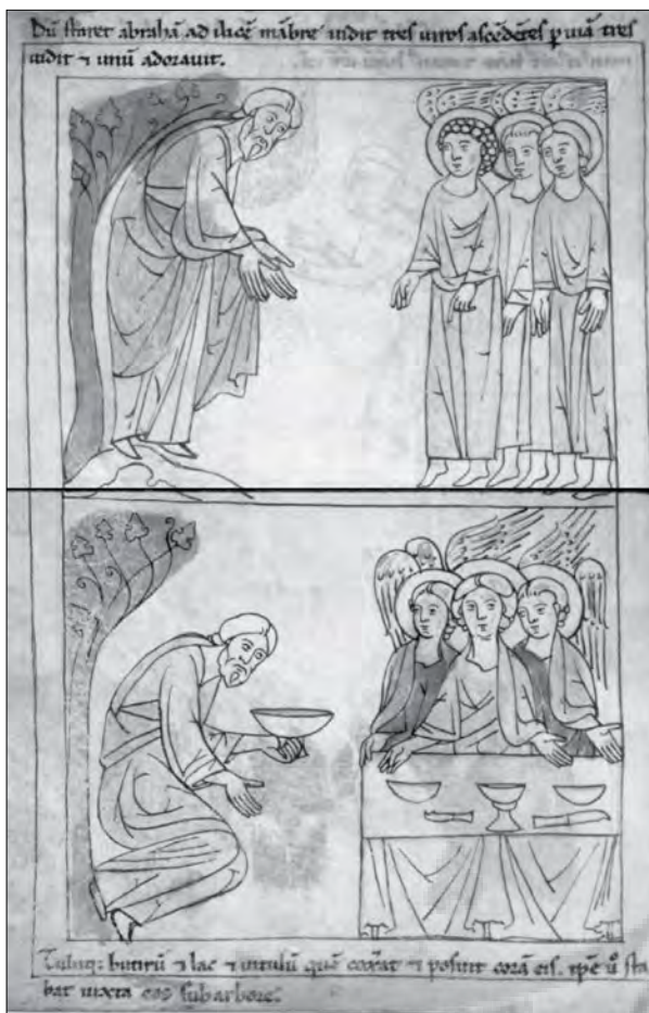
نگاره ۳: دو مینیاتور برداشته از انجیل Bible de Pampelune، منطقه کاتالونی (شمال اسپانیا)، ۱۱۹۰ م.، نگهداری در کتابخانه شهر آمین Bibliothèque municipale de la ville d'Amiens فرانسه

نیز جز برای نگارگران آشنا با ساحت حقیقت و عالم مثال میسر نمی‌باشد.