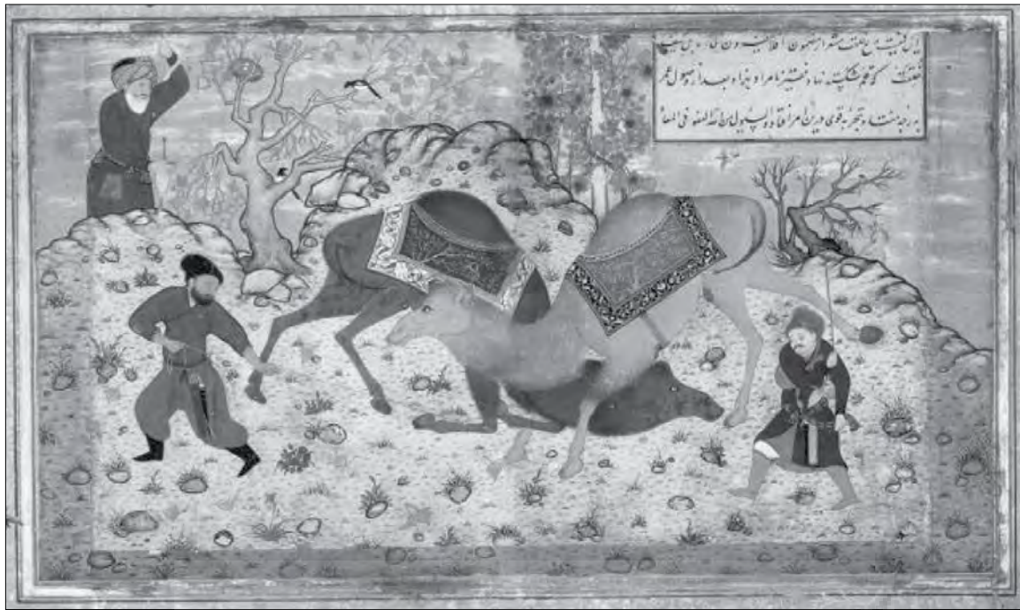
نگاره ۴: نزاع شتران، بهزاد، تبریز ۱۵۳۰، مرقع گلشن، مجموعه کاخ گلستان، تهران، ایران.