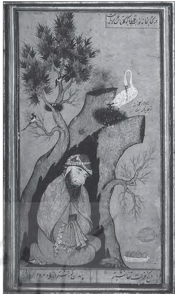
نگاره ۲: عزلت پیر، اثر ترابی، هرات ۱۵۸۷ (ق) موزه رضا عباسی، تهران، ایران

در شرح گلشن راز (لاهیجی، شرح، ص ۵۱) این بیت چنین تفسیر شده است: «و درخت حقیقت انسانی است که مجلای تجلی ذات و صفات ربانی است.» بنابراین درخت و پیر یا انسان کامل هر دو جایگاه پذیرش تجلی الهی می‌باشند.